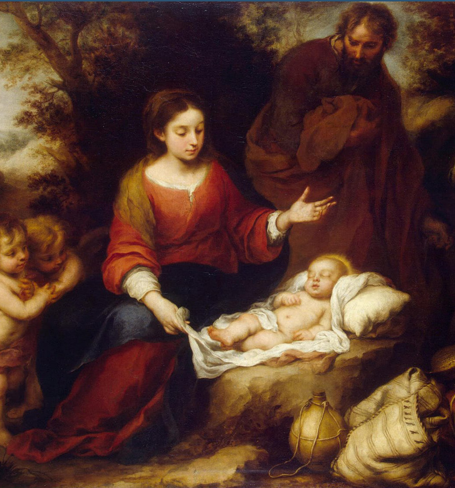
Murillo Descanso - « Huida a Egipto »

« Marie, cependant, retenait tous ces événements et les méditait dans son cœur. »