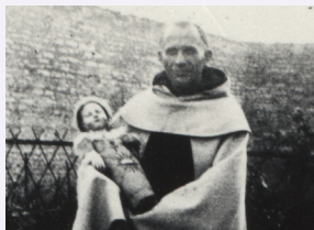
(1928, Carmel de Beaune)