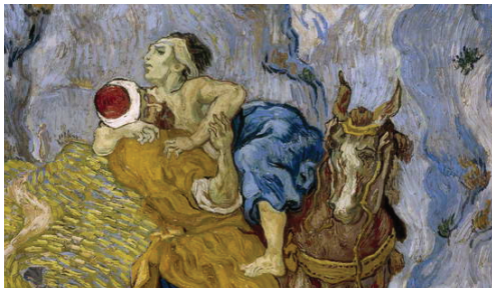
Vincent Van Gogh Le Bon samaritain