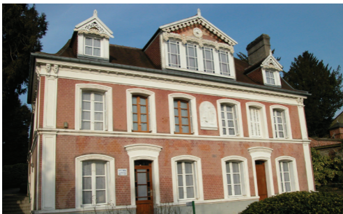
Les Buissonnets : vue de la façade

« Je ne vis guère que de souvenirs. Ces souvenirs de toute ma vie sont si doux, que malgré les épreuves traversées, il est des moments où mon cœur surabonde de joie. » ( Lettre de Louis à un de ses amis, 1883 )