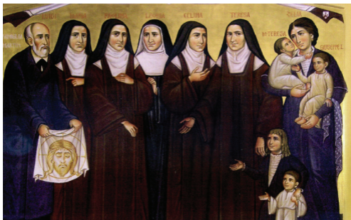
Famille Martin (icône de Paolo Orlando)

« J'entrerai dans l'état de mariage pour accomplir votre volonté sainte. Je vous en prie, donnez-moi beaucoup d'enfants et qu'ils vous soient consacrés. » ( Prière de Zélie )