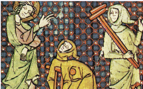
Guérison du paralytique (enluminure)