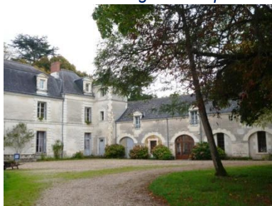
Marigny (complet !)

Deux lieux d'hébergement (prévoir un sac de couchage ou 6 € pour des draps sur place) :