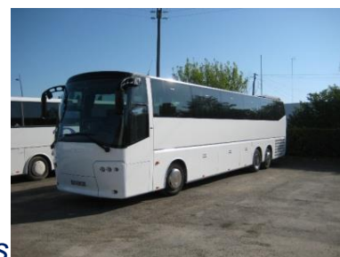
Trajet en bus depuis Paris

RENDEZ-VOUS au Couvent des Carmes, 6 rue Jean Ferrandi, SAMEDI 28 juin à 8h00 pour la Messe d'envoi